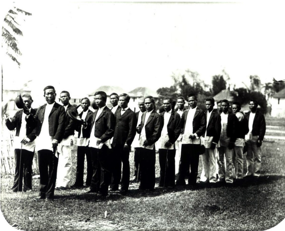
Abb. 2: Die Principalía eines Ortes (Ende des 19. Jahrhunderts)

Die Spanier richteten auf den Philippinen ein hierarchisch abgestuftes Justiz- und Verwaltungssystem ein. Auf unterster Ebene lagen Administration und Rechtsprechung in den Händen von Einheimischen. Die alten Datus fungierten nun als „cabezas de barangay“ oder als „gobnadorcillos“, also als Vorsteher eines Barangay oder mehrerer zu