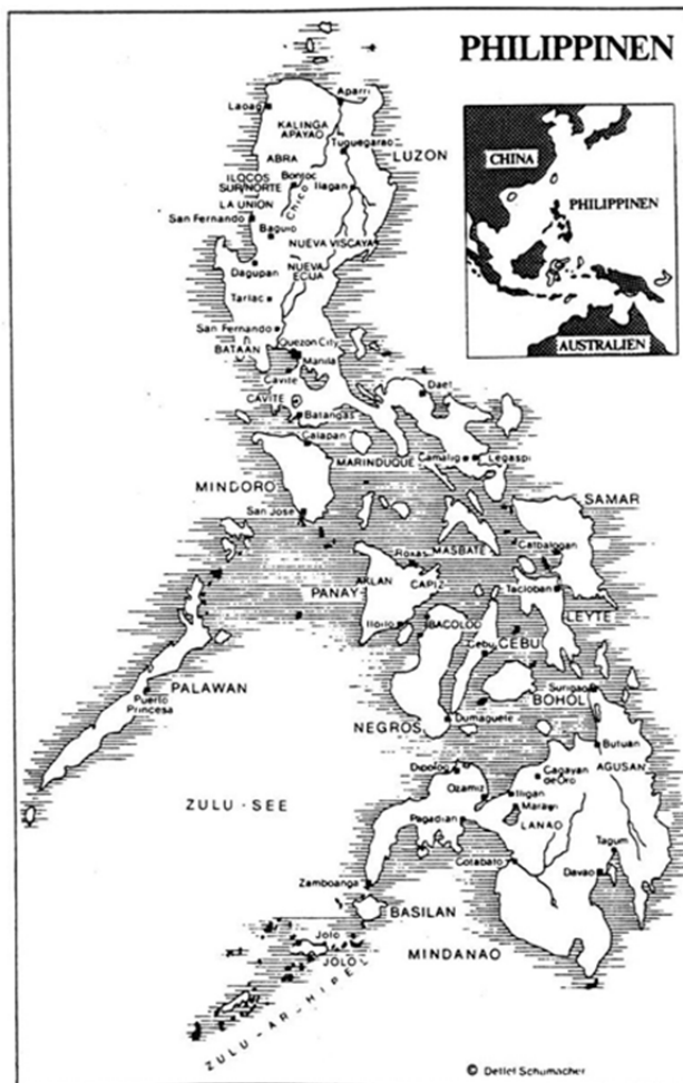
Abb. 1: Karte der Philippinen und ihrer Lage in Südostasien