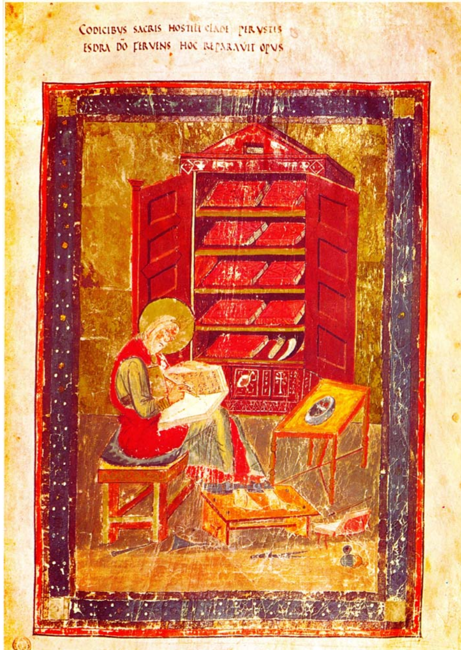
Abb. I 2: Esra im Codex Amiatinus

Aus: Ralf M.W. STAMMESBERGER: Scriptor und Scriptorium. Das Buch im Spiegel mittelalterlicher Handschriften, Graz 2003, S.29.