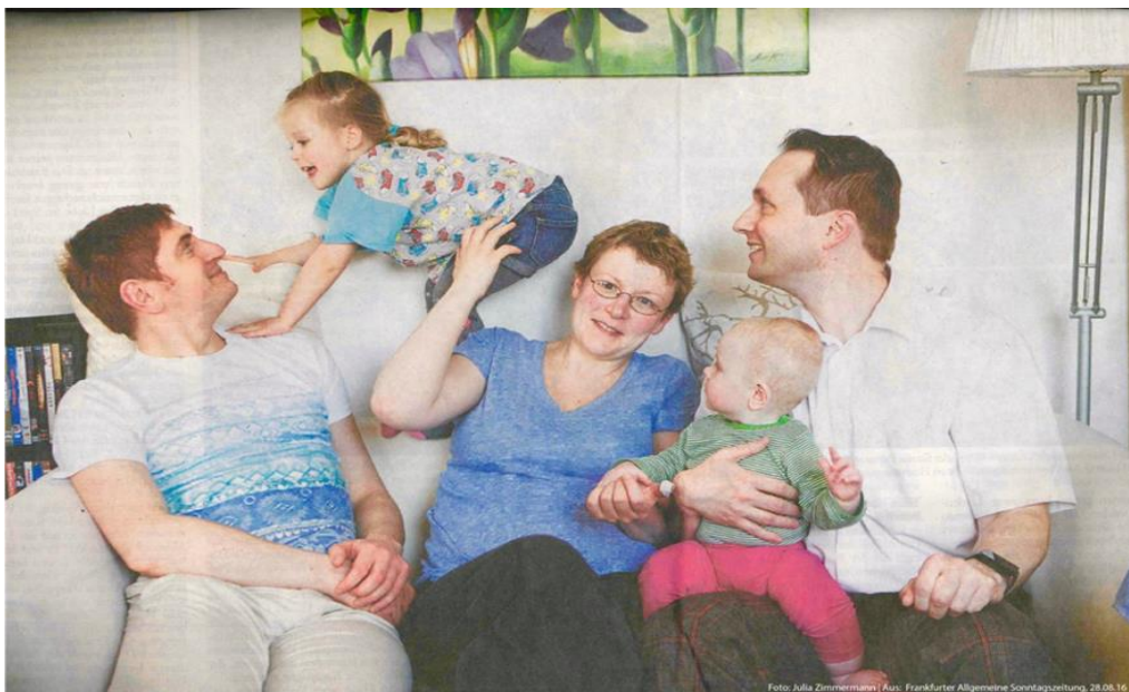
Abbildung 3: Eine gleichgeschlechtliche Familie

Zum dritten Beispiel. Die Familie besteht aus zwei Vätern, einer Frau, die die leibliche Mutter von zwei Kindern ist, die jeweils mit dem Samen einer der beiden Männer entstanden sind. Die Familie wohnt in einer Großstadt zusammen in einer Fünf-Zimmer-Wohnung. Alle drei Elternteile beteiligen sich an der Erziehung und Versorgung der beiden Kinder (vgl. Hummel 2016).