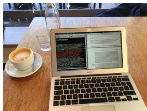
Abbildung 1.1: Impressionen wissenschaftlichen Arbeitens